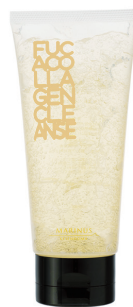
フカコラーゲンクレンジング 2016年8月発売