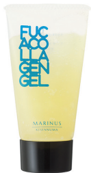
フカコラーゲンジェル 2015年7月発売